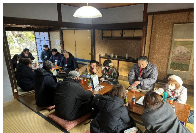
写真：侍の社で休憩中の様子