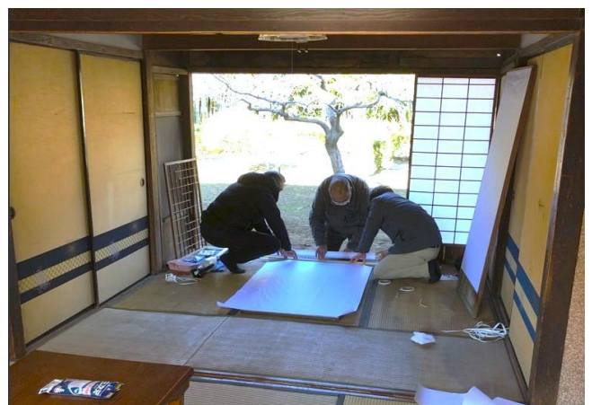
写真：侍の社 事前準備の様子