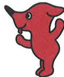
千葉県マスコットキャラクター 「チーバくん」