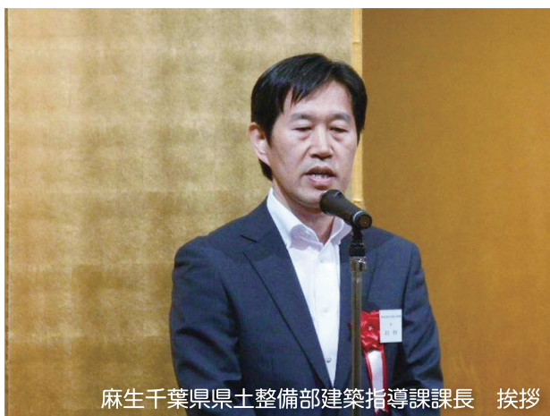
麻生千葉県県土整備部建築指導課課長 挨拶