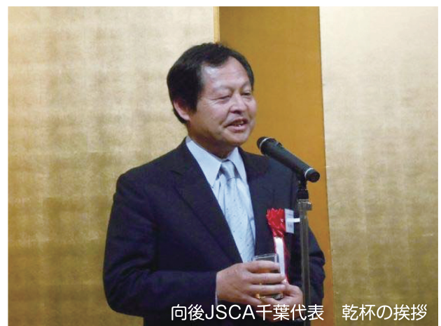
向後JSCA千葉代表 乾杯の挨拶