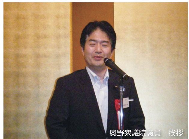
奥野衆議院議員 挨拶